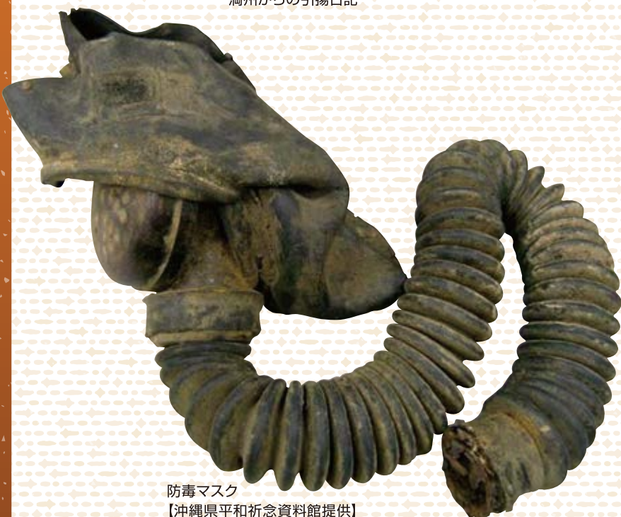
防毒マスク