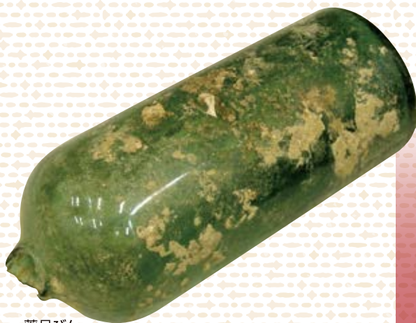
薬品びん