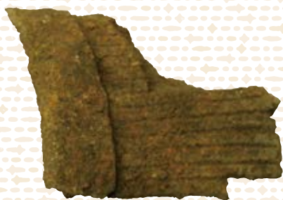
砲弾の破片

この「戦時下の暮らし展」では、県民の皆さまから提供いただいた防空頭巾、軍服などの貴重な資料のほか、戦時体制下の様子や戦争の恐ろしさを伝える写真パネルを展示します。