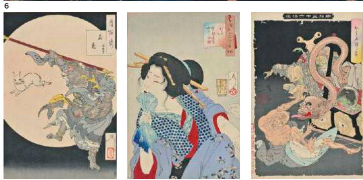
表＝一魁随筆 西塔ノ鬼若丸ノ藤原保昌月下弄笛図ノ美勇水滸伝 黒雲皇子 新形三十六怪撰 おもみつらノ義経記五條橋之図(すべて部分) 裏＝1/芳流閣両雄動 2/芳年武者先類 源牛若丸 熊坂長範 3/一魁随筆 西塔ノ鬼若丸 4/藤原保昌月下弄笛図 5/義経記五條橋之図 6/文治元年平家の一門亡海中落入る図 7/月百姿 玉兎 孫悟空 8/風俗三十二相 いたさう 寛政年間 女郎の風俗 9/新形三十六怪撰 おもみつら ※作品はすべて西井コレクション