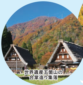
世界遺産五箇山の 合掌造り集落