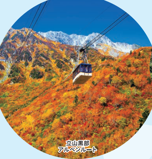
立山黒部 アルペンルート