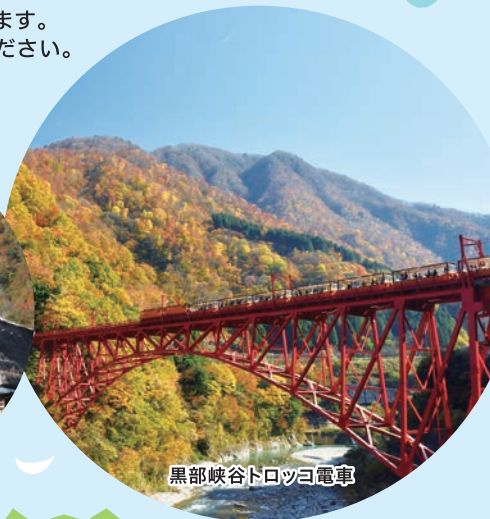
黒部峡谷トロッコ電車