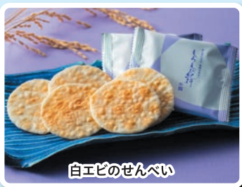
白エビのせんべい

※画像は一例、イメージです。その他特産品も多数準備しております。 ※販売数には限りがございますので、売り切れの際は何卒ご容赦ください。