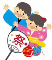
納涼祭等の施設行事に見学会をドッキング ボランティアでお手伝いも