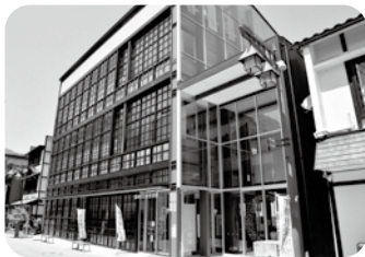
総湯「湯めぐり宇奈月」