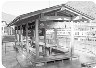
駅の足湯「くろなぎ」