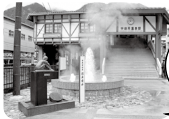
宇奈月温泉「温泉噴水」