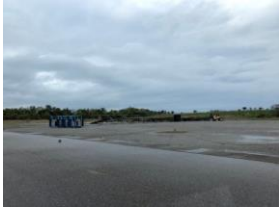
5 パーク内臨時駐車場（仮称）