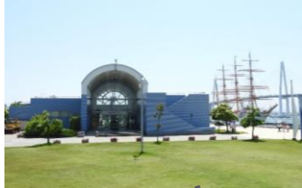
1 日本海交流センター