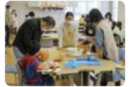
親子カボチャランタン教室(入善)

入善では、JA直売所に農産物を搬入し、季節毎の野菜や花の販売実習を実施しています。また、「入善町チャレンジ・ザ・ギネス大会」や商工会主催の「にゅぜんハロウィンパーティ」に生徒会や美術部がボランティアとして協力しています。