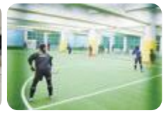
第2体育館人工芝ピロティ(石動)