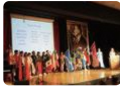
環境国際会議 (CEI2019) (大門)

大門では、「環境国際会議 (CEI)」や「北東アジア青少年グローバルリーダー育成事業」に参加し、世界の高校生と環境問題に関する意見交換、野外活動や文化活動を通して交流しています。