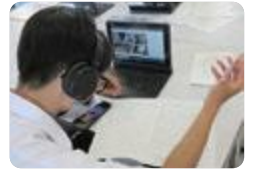
オンラインによる姉妹校交流(新湊)

新湊 では、オーストラリアのノーブルパーク校と姉妹校提携し、隔年で相互訪問交流を行っています。ホームステイをしたり、オンラインで、語学力やコミュニケーション能力を高めたりして、国際感覚を向上させています。また、商業科では、台湾修学旅行を実施しています。台湾の企業訪問や観光名所を巡り、経済や文化、歴史を学ぶとともに、学校交流を通して、語学力とコミュニケーション能力を高め、国際感覚を向上させています。