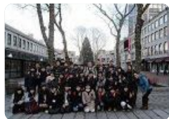
アメリカ研修(魚津)

魚津 では、1・2年生の希望者が、アメリカの大学などを訪問し、語学力や主体性・チャレンジ精神を高める海外研修を行っています。