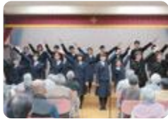
養護老人ホーム楽寿荘訪問(砺波)