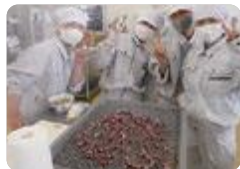
ホテルイカ料理教室(滑川)

滑川 (海洋科) では、水産・海洋資源の利活用について幅広く学びます。学校の栽培設備を活かして、稀少になりつつあるサクラマスの育成に挑戦しています。