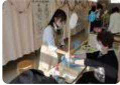
地域の高齢者との交流(となみ野)