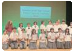
英語スピーチコンテスト(福岡)

福岡 (英語コース) では、英語セミナー、スピーチコンテスト、外部講師を招いた講演会やワークショップなどの活動を通じて、実践的な英語力を身につけます。また、学校設定科目の「Frontline English」では、時事英語を取り扱い、複数のALTとディスカッションを行うことにより、表現力を高め、国際理解を深めます。