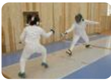
フェンシング場(富山北部)

ゴルフのショートホール(中央農業)、ボクシングリング(富山西・上市)、フェンシング場・陸上専用走路(富山北部)、海砂トレーニングロード(高岡商業)、ビームライフル射撃場(南砺福野)、人工芝のピロティ(石動・新湊・伏木)を持つ学校があります。