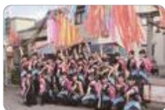
戸出七夕ダンス発表(高岡南)