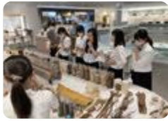
東京方面研修（富山）

高岡 では、校外でのフィールドワークを含む体験学習を経て、少人数のグループ毎に取り組む課題研究を通して、社会での課題解決力につながる力を育成します。