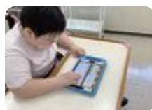
ICTを活用した日記入力 (高志支援)