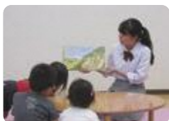
読み聞かせ（志貴野）