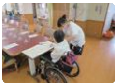
福祉体験（新川みどり野）

新川みどり野（福祉教養科）・中央農業（園芸デザイン科）・氷見（生活福祉科）・となみ野（総合福祉科） では、介護職員初任者研修を実施しています。