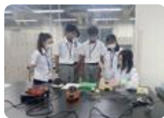
アカデミック・インターンシップ(富山大学)

県立高校の全学科で、将来就く可能性のある仕事に関連する活動を体験することで、進路意識を育み進路選択につなげることを目的に実施しています。具体的には、従来行っていた就業体験に加え、高校卒業後に進学する生徒を対象に、大学等で実験・実習・ゼミ体験をする「アカデミック・インターンシップ」や、県内企業に関する理解を促進するための「富山の企業魅力発見推進事業」を行い、県内の優良企業やオンリーワン企業を巡るなどの取り組みをしています。