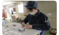
就業体験（富山高等支援）

雄峰では、「キャリア講座」を設定し、コミュニケーション能力、社会に貢献できる行動力、対人関係に必要な力を身につけています。