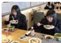
るるキッチン試食会(氷見)

氷見 (ビジネス科) では、氷見市や旅行会社と連携して地元産の食材を使ったオリジナルメニューを開発し、販売に向けて取り組むなど地域協働を進めています。