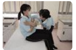
生活支援技術(南砺福野)

南砺福野 (福祉科) では、県下唯一の福祉科として高齢者・障害者等の福祉について学びます。地域を支える介護のスペシャリスト、介護福祉士の資格取得を目指し、専門的な学習や介護実習に取り組んでいます。