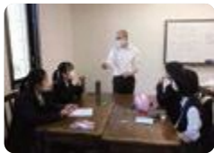
外国の学生との交流授業（南砺福野）