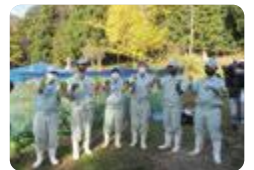
中地山カブの収穫(中央農業)

中央農業では、富山の伝統野菜である「中地山カブ」の復活に向けて地元住民と交流し、地域に笑顔の輪を広げています。また、高齢者施設や保育園を訪問し、高齢者の方々、幼児の皆さんと一緒に花苗を植えています。