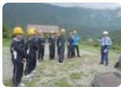
立山カルデラ視察(富山)