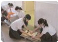
できることからエコ活動(富山いずみ)

富山いずみ では、家庭クラブ役員が4月、1年生に対してゴミ分別やリサイクルのオリエンテーションを行います。ゴミ減量をはじめ学習会を開くなど、エコ活動に取り組んでいます。