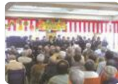
合唱や器楽の演奏交流（呉羽）