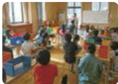
木工教室(富山工業)

となみ野では、家庭クラブが中心となり、地域の高齢者の方の介護予防策としてのオリジナルの口腔体操や低栄養予防献立の普及に取り組んでいます。