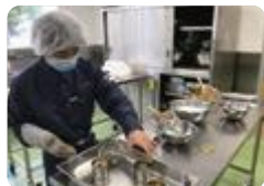
地元の水産物を利用した新商品の開発(氷見)

氷見 (海洋科学科) では、富山湾の豊かな漁場環境の保全や回復に取り組んでいます。また、水産食品加工については、地元の水産加工組合と連携して、氷見いわしの缶詰を考案するなど新商品の開発に取り組んでいます。