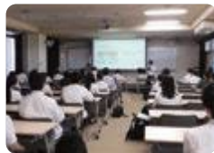
富山大学校外学修発表会（小杉）

富山南では、2年次に東京方面の企業・大学を訪問し、企業活動や大学生活の現状を学びます。また、まとめを冊子にして進路選択に活用しています。