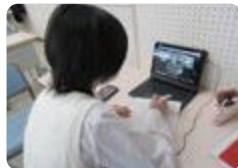
Zoom 交流 (小杉)

全ての県立学校の通信ネットワークや無線LAN環境が整備され、また、高校および特別支援学校の児童生徒および教員に1人1台のタブレット端末の配備が完了したことで、これらを日常的に活用しながら様々な学習活動に取り組んでいます。引き続き、すべての子ども達の資質や能力が確実に育成できるよう、ICTを活用した質の高い教育の実践に取り組めます。