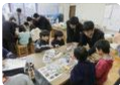
ものづくり教室（魚津工業）