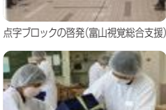
委託作業(にいかわ総合支援)