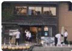
新湊を照らす(新湊)