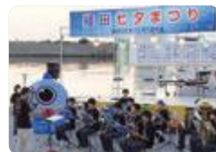
地域祭礼での演奏交流（魚津工業）

南砺福野 では、高齢者福祉施設や障害者支援施設などで、日頃の学習成果を生かして、話し相手やレクリエーションの実施、整容介助などを行っています。