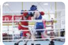
ボクシング部(上市)