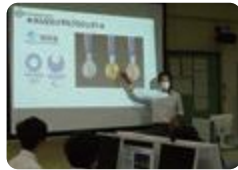
職業人が語る会（福岡）

福岡では、「職業人が語る会」を実施し、働くことの意義について考える機会を設けています。また、卒業生による「進路ガイダンス」や大学教員による模擬講義体験を通じて、進路意識の高揚を図っています。