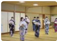
日本文化の授業（伏木）

南砺福野（国際科） では、2度の語学研修（1年次国内、2年次オーストラリア）を実施し、英語と外国文化について学びます。また、隔年でオーストラリアの友好交流校からの短期留学生を受け入れ、友好を深めます。さらに第2外国語として基礎的な中国語を学ぶことで幅広い視野と豊かな国際感覚を養います。この他、様々な国際交流活動を積極的に行っています。