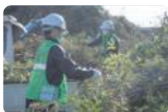
剪定枝リサイクルボランティア(砺波)