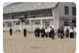
スマート農業研修会（小矢部園芸）