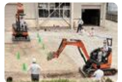
小型車両系建機講習（桜井）

富山工業（定時制） は、県内唯一の夜間の工業高校です。少人数によるきめ細やかな指導のもと、専門技術の修得に励むとともに、就職に役立つ国家資格の取得にも挑戦し、成果をあげています。