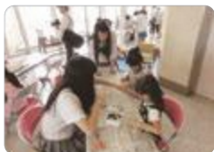
学童保育ボランティア（富山西）