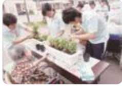
園芸セラピー(南砺福野)