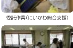
ボランティア清掃(しらとり支援)