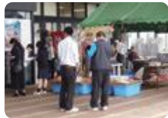
課題研究での聞き取り調査(新湊)

新湊 (商業科) では、地域社会と連携した体験的な学習を行っています。地元商工会や中小企業同友会、射水市観光協会と連携をとりながら、講演や見学、体験実習を行い、企業・大学等の協力を得て、キャリア教育の充実を図り、社会人基礎力の向上と地元活性化への貢献を目指しています。