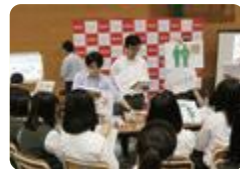
職業を知る会（上市）

八尾 では、様々な職業で活躍する卒業生を招いて進路希望に沿った講話を聞いたり、八尾中核工業団地の企業を見学し、仕事への理解を深めたりします。また、大学の講師を招いて進路希望に合わせて授業を体験し、進路への理解を深めます。