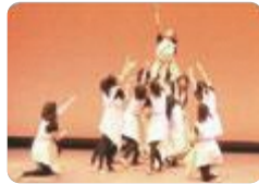
創作ダンス発表会

また、全校生徒が20kmを歩く強歩大会(富山東)、果敢な精神と強健な身体づくりを目的として、5月の海に飛び込む海洋科の伝統行事「日本海開き」(滑川)、生徒全員参加のマラソン大会(上市・雄山・中央農業・新湊・南砺平)、早朝寒稽古(高岡)など、ユニークな活動で心身ともに鍛えています。