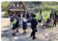
観光ガイドボランティア（南砺平）