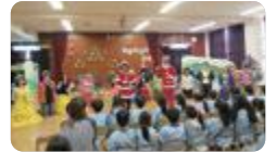
保育園でのクリスマスコンサート(新湊)

コンサートや演劇、美術展や書道展を行っている学校、吹奏楽部や管弦楽部が地域コンサートに積極的に取り組んでいる学校（富山商業・呉羽・新湊・高岡商業・氷見）があります。