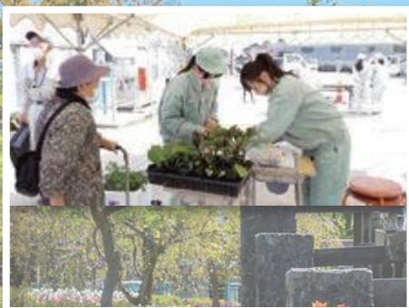
野菜苗・花壇苗販売