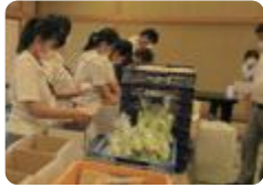
特産物梱包作業(石動)