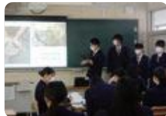
ICT を活用した授業 (福岡)

小杉では、英語重視コース所属の生徒を対象に、カリフォルニア大学アーバイン校の学生とZoom交流を行っています。お互いの趣味や学校生活といった身近な話題はもちろん、SDGsを中心とした社会問題についても意見交換を行い、理解を深めています。