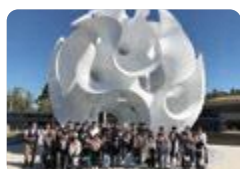
アメリカ研修(富山中部)

富山中部 では、希望者によるアメリカ研修、オーストラリア研修、中国遼寧省との交流活動を行っています。ホームステイ、語学研修、現地実習の他、大学や企業訪問を通して最先端の研究に触れ、グローバル社会で活躍する素養を深めます。