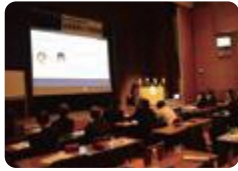
自然科学コース発表会(富山東)

富山東(自然科学コース) では、「探究する可能性を育てる」プログラムが充実しています。(県総合教育センター実習、筑波研修、高大連携事業(筑波大学・富山県立大学・富山大学)、理数探究発表会)