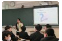
サイエンス・ダイアログ(富山)

富山 では、国内の大学や機関で活躍している若手外国人研究者から、英語で研究の話聞き、探究心を育て、国際理解を深めます。