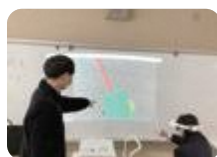
ICTを活用した学習 (となみ総合支援)