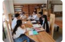
イングリッシュキャンプ (富山南)

富山商業・富山南・小杉・新湊・高岡商業 (国際ビジネス科)・伏木・福岡・南砺福野では、ALT や英語教員との英語による活動を通して、英語でコミュニケーションする楽しさを味わい、学習意欲を高めています。