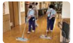
福祉施設での実習（高岡聴覚総合支援）

富山聴覚総合支援・高岡聴覚総合支援の福祉・サービス科では、地元企業と連携しながら就業体験を行うとともに、学校近隣の福祉施設で実習を行っています。