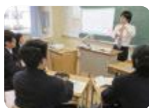
手話を使った学習 (富山聴覚総合支援)