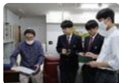
地域でのインタビュー (入善)

すべての学校で、交通安全教室や、火災や地震などに備えた組織的な防災訓練が行われています。また、多くの学校が性教育、喫煙防止、薬物乱用防止、防犯などの教室を実施しています。