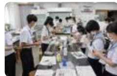
サイエンスアカデミー(富山中野)

富山では、オープンハイスクールや中学校の学習会などで、高校生が教えています。教えることを通じて、本当の学び方を身につけるとともに、キャリア形成の一助としています。