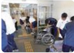
車いすの清掃作業(砺波工業)