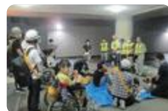
避難訓練(富山総合支援)

生時には、町内会の協力を得て避難することになっているため、訓練にも町内会から参加いただき、連絡方法や協力体制について確認しています。また、作業班の一つであるオフィスサービス班が、近隣のバス停や通学路の清掃などのボランティアを行っています。