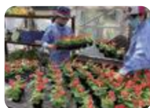
温室での花の栽培 (にいかわ総合支援)