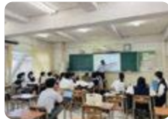
探究活動（富山いずみ）

富山いずみでは、2年次に南富山のまちづくり活動をテーマに探究活動を実施しています。