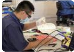
ものづくりコンテスト(砺波工業)

砺波工業 では、資格取得やものづくりに積極的に挑戦しています。電気科では、電気工事士試験において9年連続で全員合格しています。また、機械科、電子科では、高校生ものづくりコンテストにおいて優秀な成績を収め、全国でも活躍しています。