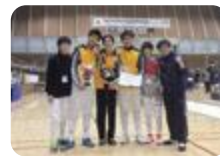
フェンシング部(富山西)