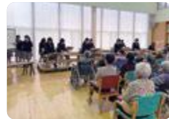
特別養護老人ホーム訪問（大門）