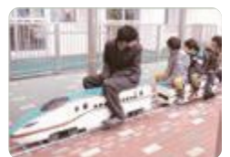
イベントでのミニ新幹線（富山工業）