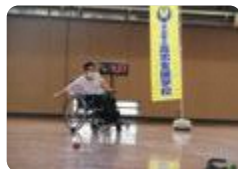
全国ボッチャ選抜甲子園(高志支援)

富山総合支援では、ボッチャ競技に親しむ活動の充実に取り組んでいます。毎年実施している全校ボッチャ大会に先立ち、パラアスリートを講師に迎えてのボッチャ体験会を実施します。