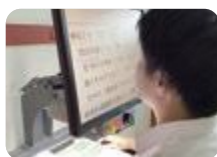
視覚補助具を使った学習 (富山視覚総合支援)