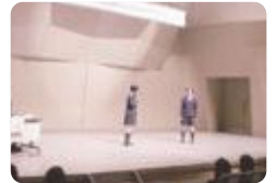
富山県英語プレゼンテーション コンテスト

レシテーション部門 (指定作品の暗唱)・スピーチ部門・リサーチプロジェクト部門 (調査研究発表) の3部門にわかれ、日頃の取り組みの成果を競います。