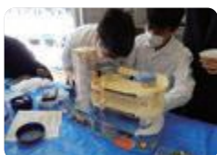
おもちゃの病院（砺波工業）