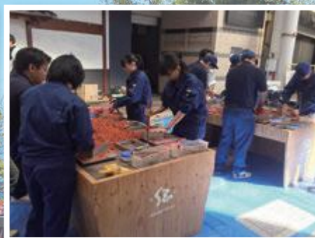
ものづくり体験教室