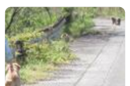
モンキー犬の活動(中央農業)

中央農業では、動物を活用した、中山間地域の害獣防除システムを確立させ、さらにその情報等を地域に提供し、SDGsの取り組みを地域の活性化など社会貢献につなげています。