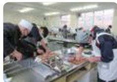
魚のおろし方講座 (伏木)

消費生活講座、料理コンクール、テーブルマナー教室、礼法講座などのほか、郷土料理を学ぶ (雄山)、テーブルコーディネイト講習会、製菓調理講習会、西洋料理講習会 (桜井)、そばうち講座 (八尾・中央農業)、パン・ジャム作り講習会 (中央農業)、富山湾の鮮魚をさばく講習会 (伏木・新湊・志貴野)、ドレス製作講座 (氷見) などの活動もあります。