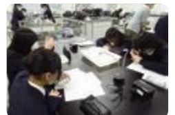
科学探究力アップ講座（小杉）

小杉では、ICT機器を活用した探究型学習の実践を試み、学校生活、社会生活に主体的に取り組む生徒を育てています。