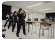
ビームライフル射撃場(南砺福野)