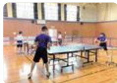
卓球部の活動(高岡聴覚総合支援)

富山聴覚総合支援・高岡聴覚総合支援では、生徒全員が卓球部に所属し、県内の各大会や、北陸地区並びに全国聾学校卓球大会に出場しています。