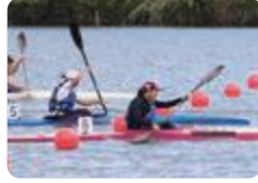
体育コース(富山北部)

富山北部(体育コース)は、陸上競技・サッカー(男)・テニス・野球(男)・フェンシング・カヌー・水球(男)・剣道の8種目の競技力向上と将来のスポーツリーダーの育成を目指すスポーツの専門コースです。また、エキスパートから直接指導を受ける「スポーツ学」講座やスポーツに関する探究活動も行っています。