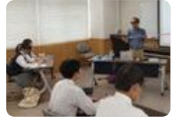
「生活と福祉」特別授業(雄峰)

雄峰 (生活文化科) では、生活の文化や教養を幅広く追究するとともに、立地を生かした保育・福祉関連の校外見学・体験学習を行っています。