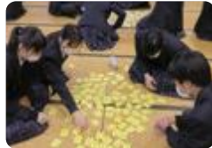
SET かるた (伏木)

伏木では、SET (Short English Time) Program として、毎朝、全校放送でネイティブの会話を聞いて英会話の学習をしています。また、SET Textbook、SET かるたを作成し、活用しています。