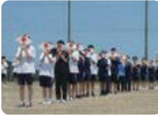
体育大会(新川みどり野)

体育大会はほとんどの学校で開かれています。生徒が自主的に企画し、活動の運営を行う学校(新川みどり野・魚津・富山・富山中部・富山商業・高岡・氷見)、小・中・高の合同で行っている学校(南砺平)もあります。スキー合宿、マラソン大会、創作ダンス発表会を実施する学校もあります。また、県内4地区で創作ダンス発表会を実施しています。