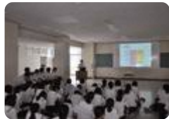
探究講座(高岡商業)

高岡商業 では、模擬株式会社を設立し、地域にちなんだ商品開発や販売活動など実践的な学習を行い、専門分野におけるスキルやマナーを身に付けています。