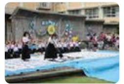
書道パフォーマンス(呉羽)

呉羽 では、書道部が「4m×10m」の巨大な紙に書く書道パフォーマンスを行っています。