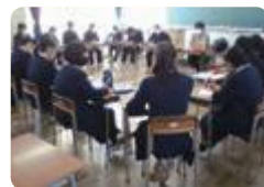
進路座談会（富山東）

新湊 では、1年次に様々な職業で活躍する卒業生やPTA、地元企業の方を講師に招き、仕事への理解を深めています。