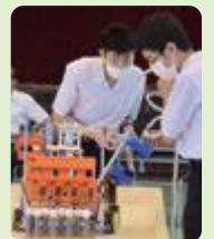
ロボット競技大会(砺波工業)