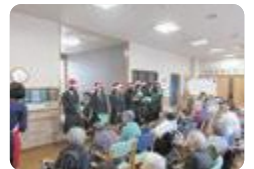
ボランティアサポーター(上市)

上市では、社会福祉協議会からの委嘱を受けて、高齢者施設や保育園などでのボランティア活動、ふれあいフェスティバルの活動支援などを中心に多彩な活動を行っています。