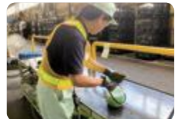
就業体験（富山聴覚総合支援）

富山高等支援・高岡高等支援では、高等部1年次から校外就業体験を行うとともに、日頃の作業学習においても外部講師による指導、企業からの受注作業、近隣施設での実習などを行っています。