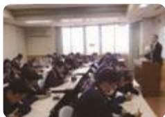
新入生合宿（富山中郡）