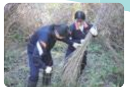
茅刈り体験(南砺平)

南砺平 では、地元保存会と連携し、国指定無形民俗文化財の郷土民謡を習得したり、合掌造りの屋根となる茅を刈ったりする活動を行うとともに、五箇山の伝統文化や歴史、自然環境を調査研究しています。