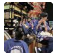
伏木曳山祭囃子方(伏木)

高岡 では、小倉百人一首の札を瞬時に取り合う競技かるた部が、個人としてはA級選手を、団体としては全国大会での入賞を目指して取り組んでいます。