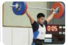
ウエイトリフティング部(滑川)