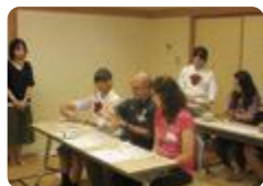
国際交流・日本文化の体験(富山西)

富山西 では、1・2年生の希望者が、毎年アメリカオレゴン州にある姉妹校のサム・バーロウ高校を訪問し、ホームステイをしながら実際の授業に参加するなど、交流を行っています。