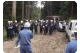
ひみり山杉の伐採体験（氷見）

氷見では、1年次に「未来講座HIMI学」で、市職員や地域の産業界の方々と協働した学びを展開しています。地域課題をテーマとしたフィールドワークや出張講座を通じた探究学習で、地域の自然・文化・社会に触れながら、学びを深めています。