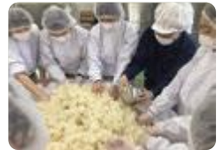
米の冷却と麹菌の種付け（南砺福野）

小矢部園芸（園芸科） には、薬剤散布のための農業用ドローン、ラジコン草刈り機、自動で作物の収量と品質が分かるコンバインがあります。企業から講師を招き研修会も行っており、AI（人工知能）を活用した、農作業の労力を減らす最先端の「スマート農業」に直接触れることができます。