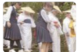
布橋灌頂会ボランティア(雄山)

雄山では、立山町の伝統的行事「布橋灌頂会(ぬのぼしかんじょうえ)」の運営に協力しています。また、「ふれあい食堂」や「図書館での読み聞かせ」にボランティアとして参加しています。