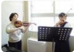
弦楽器の個人レッスン(呉羽)

呉羽（音楽コース） では、基礎から器楽・声楽の高度な専門教育まで個人に合わせて指導するとともに、数多くのコンサート、大学の講師による公開レッスン、卒業演奏会などを実施しています。