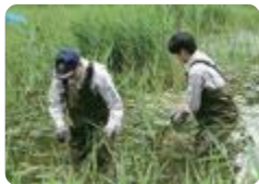
イタセンパラ保護池除草(氷見)