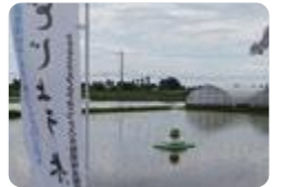
中農MIRAI米作りプロジェクト(中央農業)

中央農業 では、SDGs中農MIRAI米作りプロジェクトやSDGs中農耕作放棄地解消プロジェクトにより持続可能な次世代型水稻栽培法の開発や豊かで美しい農村を将来に残すための研究と学習に取り組んでいます。