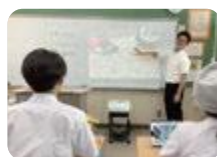
ICTを活用した教科学習 (ふるさと支援)