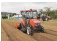
GPS搭載トラクタ運転実習（中央農業）

中央農業 では、ドジョウやアイガモロボットを活用したアクアポニックス水稻栽培法やGPSを搭載した最先端の農業機械等を活用したスマート農業の実践、牛糞堆肥の製造と活用など循環型農業の実践、「中農味噌」や「桜クッキー」などの食品加工を目指した取り組みを行っています。また、畜産関係で「GAP」に取り組み、生産者・消費者とともに安全・安心な食材提供を目指しています。