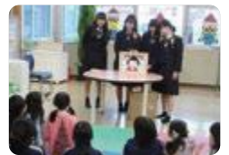
自作紙芝居による学童保育でのボランティア(氷見)

砺波工業 では、電子工学部のeSport班が全国大会へ出場したり各種イベントに参加したりしています。