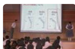
ビジネスマナー教室(富山商業)

富山商業では、地域貢献の一環として地元中学校に出向いて「ビジネスマナー教室」を行っています。