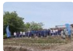
稲葉山での花苗植栽活動（小矢部園芸）