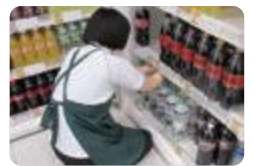
就業体験（高岡高等支援）

高等特別支援学校及び高等部を設置する特別支援学校（12校）では、将来の職業生活や社会生活における自立に向けて、地域や地元企業、施設などと連携し、作業学習、就業体験、生活体験を行っています。