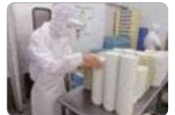
就業体験（富山総合支援）

富山総合支援では、毎年1年次から地元企業等と連携して就業体験を行っています。また、生活介護施設において生活体験を行う生徒もいます。