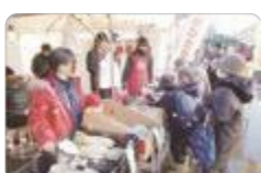
歳の大市(南砺福野)