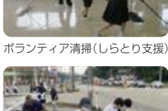
地域清掃ボランティア(高岡支援)

生時には、町内会の協力を得て避難することになっているため、訓練にも町内会から参加いただき、連絡方法や協力体制について確認しています。また、作業班の一つであるオフィスサービス班が、近隣のバス停や通学路の清掃などのボランティアを行っています。