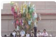
高岡七夕飾り付け(志貴野)