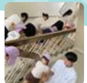
保育園児との水害避難 訓練 (高岡南)

高岡南では、戸出保育園とともに合同水害避難訓練を実施し、防災について考える機会としています。