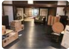
廃材を再利用して制作した家具 (高岡工芸)

高岡工芸 では、プロジェクト学習を推進し、生徒が自ら課題を見つけ、それについて調査・研究・発表を行います。昨年度は、コンテストで最優秀賞を獲得したグループは八尾の廃材を再利用して古民家に合う家具を複数製作しました。