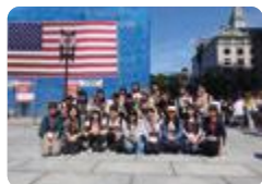
アメリカ研修(富山)

富山 では、1・2年生の希望者が、アメリカ・ボストンの大学で世界の高校生と交流する語学研修をはじめ、ハーバード大学、マサチューセッツ工科大学などを訪問し、最先端の学問研究に触れます。