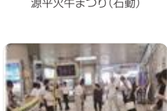
点字ブロックの啓発(富山視覚総合支援)