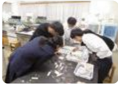
SS発展探究（富山中部）