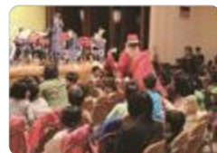
ハートフルクリスマス（八尾）

滑川 では、海洋科2年生が取得したダイビング資格を活用して、水族館の水槽清掃をし、地域貢献しています。