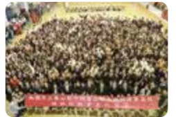
海外修学旅行(高岡商業)

高岡商業 では、2年生全員が海外修学旅行(台湾)に参加し、日本からの現地進出企業や大学を訪問しています。現地の高校生との交流会を通して、次世代を担う若者として、今後、我が国がアジア諸国とどのように関わっていけばよいかなど国際理解を深めています。