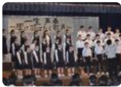
合唱コンクール(雄山)

例年、多くの高校で文化祭が実施されています。生徒の手で企画や運営を行う学校（魚津・高岡・氷見）やクラスで研究テーマを決めて発表・展示を行う学校（富山）があります。