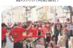
源平火牛まつり(石動)