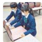
家庭クラブ活動（富山西）