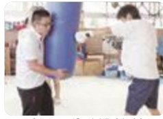
ボクシングの授業(上市)

上市(総合学科スポーツ科学分野)では、ダンスの基本ステップやボクシングのトレーニング法などを学び、運動に関する専門知識の習得と能力の向上を目指しています。スポーツの中で体力要素を最も多く含むボクシングを基礎から授業で学ぶことができます。