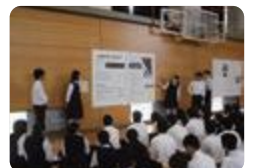
探究的な活動（高岡南）

高岡南では、富山大学と連携し、探究力や自己発信力を育成する探究的な活動に取り組んでいます。また、データサイエンス講座や、希望者による大阪大学・富山大学実習を実施しています。