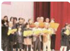
生徒と社会人の合同発表(となみ野)

新川みどり野・雄峰・志貴野・となみ野 では、それぞれ生涯学習カレッジ地区センターと合同で学園祭・学遊祭やキャンパスフェスティバルを行い、交流しています。