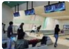
通信制のボウリング大会(雄峰)

志貴野では、東洋通信スポーツセンターでビーチボールなどのスポーツ大会を実施しています。