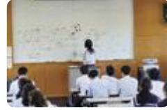
ジュニア数学ゼミナール(高岡)

高岡では、数学に関心のある中学生を対象に「ジュニア数学ゼミナール」を開催し、高校生が学習のサポートを行っています。