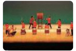
和太鼓部(となみ総合支援)

となみ総合支援 の和太鼓部は、平成9年度の発足以来、地域のイベント等に出演し、有意義な交流をしています。