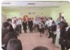
ロシア語入門（志貴野）