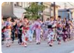
伏木港まつり(伏木)