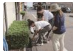
いわせのクリーンアップデー（富山北部）

小矢部園芸 では、年2回全校生徒が地元地区を周り清掃美化活動を行っています。また、地元企業、市役所と合同で花苗植栽活動なども行ったり、生産した野菜をイタリアンレストランに提供したりしています。