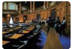
アメリカ研修(砺波)

富山東・呉羽・砺波 では、1・2年生希望者のアメリカ研修を行っています。現地では、インターナショナルクラスの語学研修をはじめ、マサチューセッツ工科大学やハーバード大学への訪問、現地で活躍する日本人の起業家との懇談といった充実したプログラムに参加します。