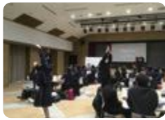
ウィンターセミナー(高岡南)

小杉（総合学科美術・スポーツ系列美術分野） では、素描・構成・絵画・陶芸等を専門的に学び、美術の表現力や創造力の向上を目指しています。