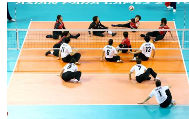
シッティングバレーボール