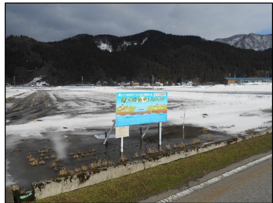
黒部川地域地下水利用対策協議会での涵養事業（朝日町内）