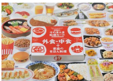
料理カード 菓子・外食・中食