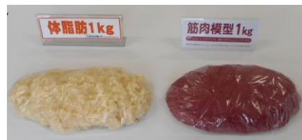
模型 (体脂肪と筋肉)