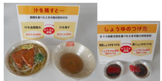
目で見て分かるシリーズ「減塩」