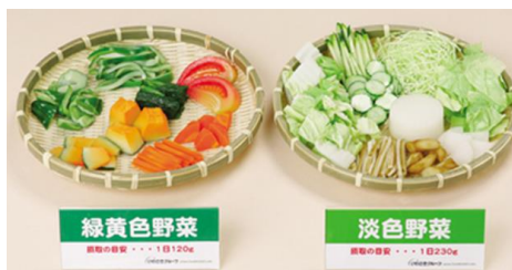
野菜 350g モデル