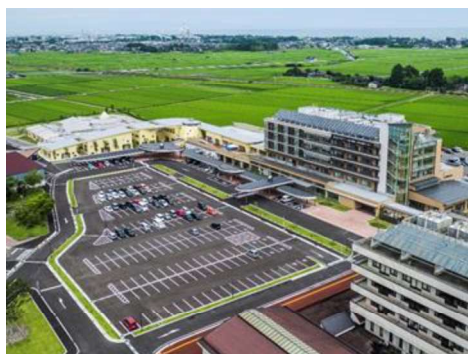
富山県リハビリテーション病院 ・こども支援センター