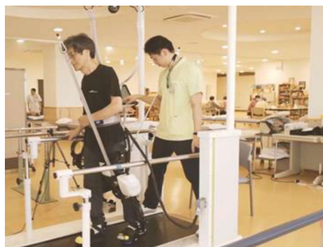
リハビリテーション風景