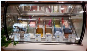
ジェラートショーケース