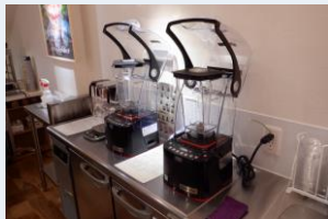
スムージーブレンダー