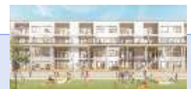
創業支援施設等のイメージ