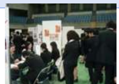
合同企業説明会イメージ

就職氷河期世代を対象とした「正社員就職プログラム(適職診断、エントリーシート、面接対策等)や合同企業説明会、スカウト型面接会を開催し、民間企業への正社員就職を支援