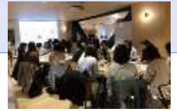
移住・Uターン女子トーク