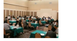
大都市圏での商談会(大阪)