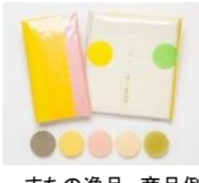
まちの逸品 商品例