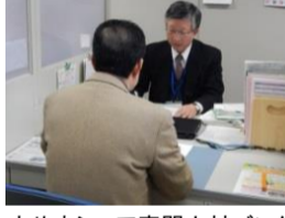
とやまシニア専門人材バンク