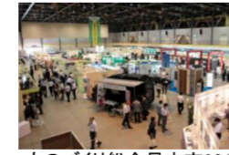
ものづくり総合見本市2012