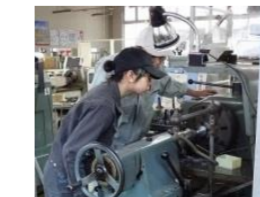
高度技能人材育成研修