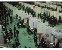
Uターンフェア イン とやま