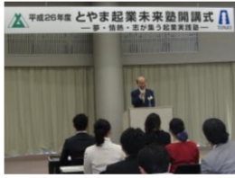
とやま起業未来塾開講式