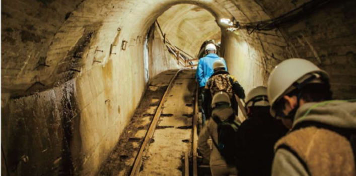
黒部峡谷パノラマ展望ツアー (イメージ) 通常は立ち入ることのできない関西電力施設内を「専用列車」「トンネル」「竖坑エレベーター」で通り抜け、パノラマ展望台から北アルプスの山々を間近に望む特別ツアーです。

6/7・21、7/26、8/2・16、9/20、10/11・18発限定 黒部峡谷パノラマ展望ツアー