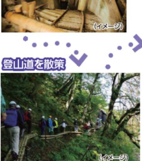
登山道を散策 (イメージ)