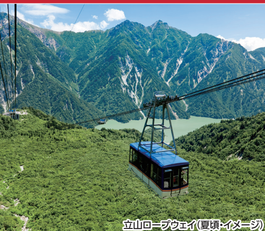
立山ロープウェイ(夏頃・イメージ)