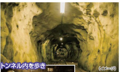
トンネル内を歩き (イメージ)