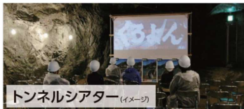
トンネルシアター (イメージ)

関電トンネル工事跡見学ツアーとは、普段は入ることができない、唯一黒部ダムに建設当時のまま残っている素掘りのトンネルの中で関西電力製作の「くろよん建設工事記録」を鑑賞いただけます。終了後、ガイドが黒部ダムまでご案内いたします。