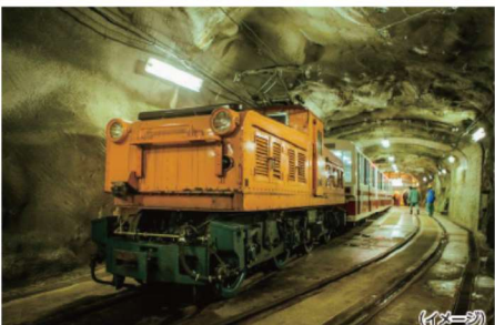
専用列車で移動します (イメージ)