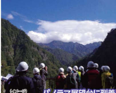
パノラマ展望台に到着! (イメージ)

黒部峡谷パノラマ展望ツアーのご案内・注意事項 ※当企画は、普段入れない関西電力の施設内を通行する特別企画となります。事前に以下の内容をご理解いただきご参加願います。●ご参加は小学校5年生以上で、乗り物の乗降や登山道の歩行に支障のない方とさせていただきます。●お申込後参加者全員の氏名、年齢、代表者の住所等の個人情報をご提供いただきます。●安全確保のためヘルメットを着用していただきます。(ヘルメットは関西電力が用意し当日お渡しいたします。)●工事中トンネル内や山道など、足場の不安定な箇所を歩行しますので登山靴やトレッキングシューズなどの歩きやすく滑りにくい履物でご参加ください。※お申込後、詳しくまとめた留意事項書面をお渡しいたします。必ずお読みください。天候やその他事由などにより、パノラマ展望台への徒歩移動が困難な場合は、竖坑トンネル内部の研修庫にてパノラマ展望台からの眺望を映像で紹介するとともに黒部川第三発電所建設時の記録映像をご覧いただけます。他のお客様と混乗になる場合がございます。