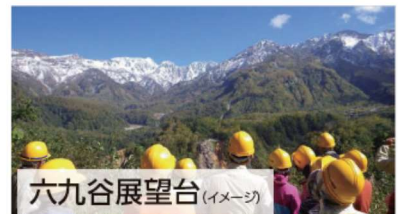
六九谷展望台 (イメージ)

20世紀遺産を巡る 立山カルデラ砂防体験ツアーのご案内・注意事項 ●見学地は国内有数の崩壊地であり、現在も大規模な砂防工事が行われている現場です。この企画には思わぬ危険に遭遇する可能性があることあらかじめご了承の上ご参加ください。また、天候にも影響を受けやすい企画となります。尚、前日12時の段階で、翌日(ツアー日)の降水確率が50%以上の場合は雨天コースへ変更となります。(※世界でも有数の降水量となる地域です。例年の実施率は6~7割程度となります。)●ご参加は小学校3年生以上で、乗り物の乗降や歩行(2km程度)に支障のない方とさせていただきます。尚、山道を含み、バス移動が往復で約4時間以上となります。●立山カルデラ内及びその周辺は安全のため、博物館が用意するヘルメットを着用いただきます。●所定書式にて、参加者全員の氏名、年齢、代表者の住所等の個人情報並びに、参加に関する同意書を提出していただきます。 ※その他、詳しくまとめた留意事項書面をお渡しいたします。必ずお読みください。他のお客様と混乗になる場合がございます。