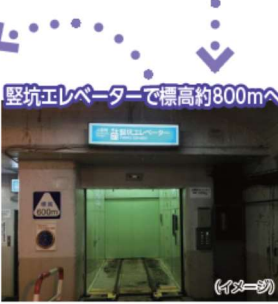
竖坑エレベーターで標高約800mへ (イメージ)