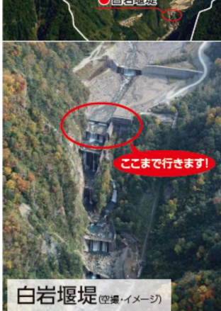
白岩堰堤 (空撮・イメージ) ここまで行きます!