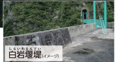
しらいわえんてい 白岩堰堤 (イメージ)