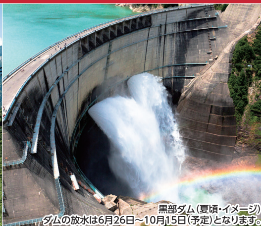
黒部ダム(夏頃・イメージ) ダムの放水は6月26日~10月15日(予定)となります。