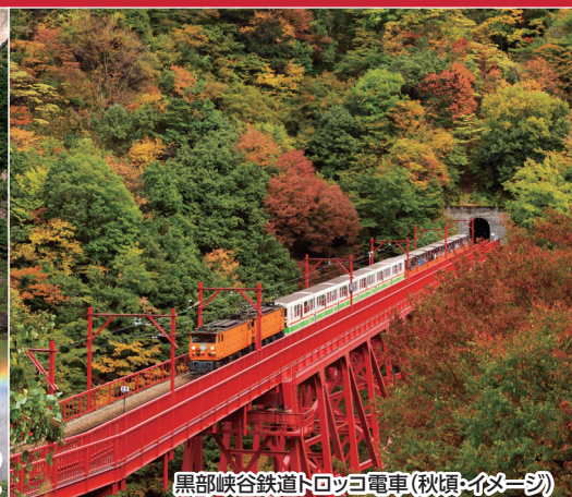
黒部峡谷鉄道トロッコ電車(秋頃・イメージ)