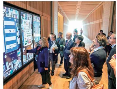
ポスタータッチパネル体験