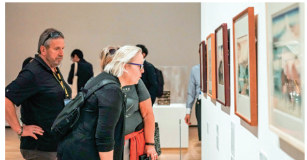
企画展の作品に見入る参加者