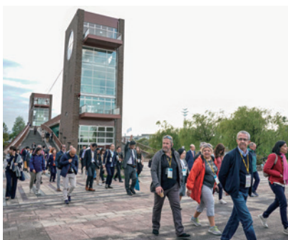
散策を楽しむ参加者