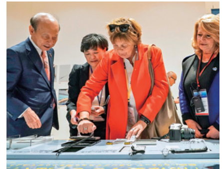
企画展で版画に挑戦