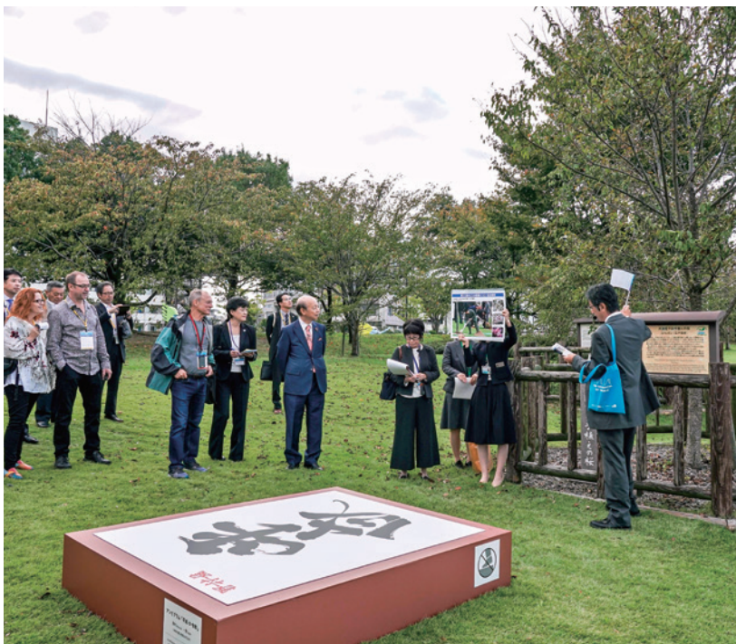
天皇陛下（当時は皇太子殿下）お手植えの「エドヒガン」