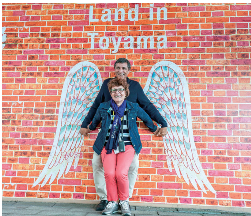
テボ次期理事長夫妻（天門橋下にて）