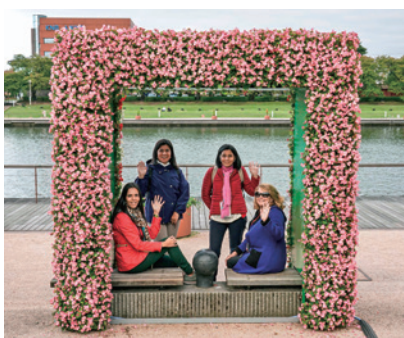
公園内フォトスポットにて