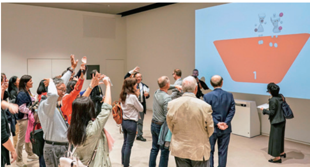
インタラクティブアート体験