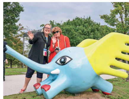
「ミルゾー」のモニュメントと