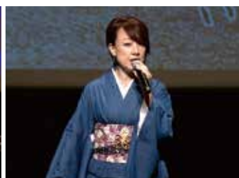
共同ライブコンサートの様子