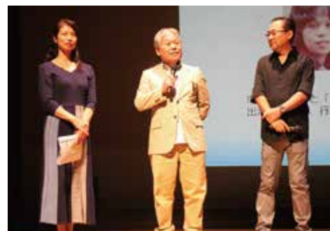
被害者御家族による呼びかけの様子

(※)「特定失踪者」とは、民間団体である「特定失踪者問題調査会」が、 「北朝鮮による拉致かもしれない」という御家族の届出等を受けて独自に調査の対象としている失踪者のこと。