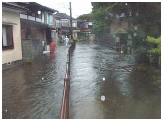
平成 24 年 9 月 沖田川