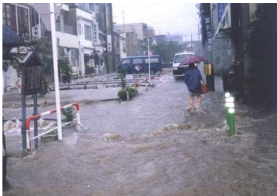
平成 10 年 7 月 鴨川