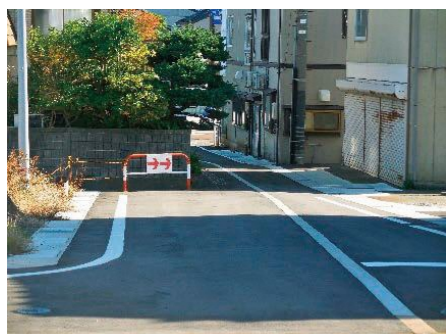
市道拡幅・無電柱化