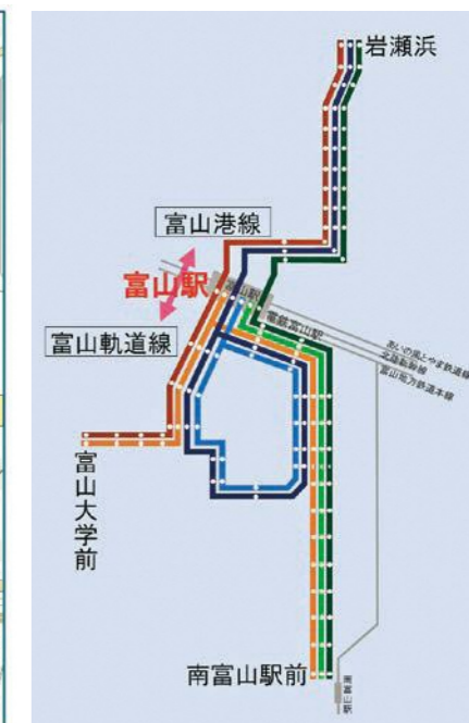
南北接続後の運行