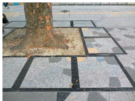
ケヤキの保全・歩道デザイン