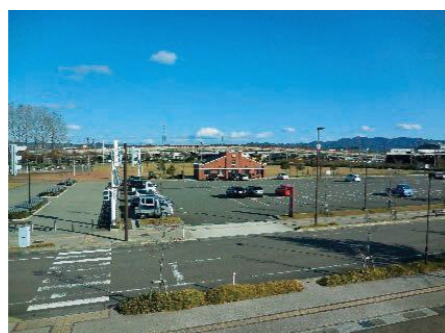
防災拠点である都市公園