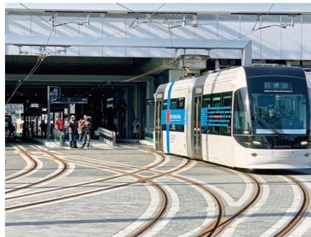
南北直通運行する路面電車（富山駅北口）