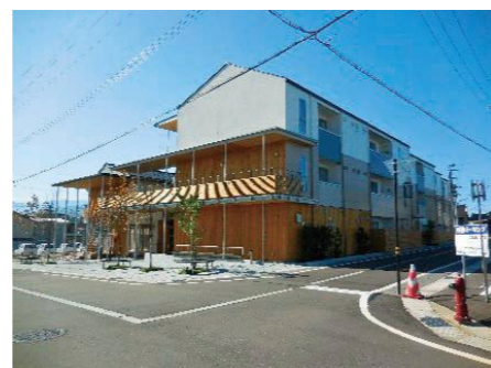
復興市営住宅整備