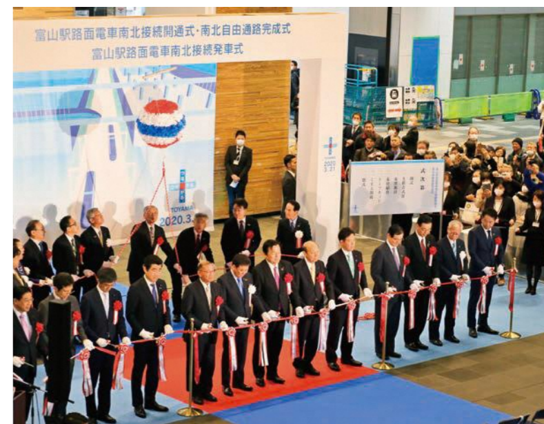
富山駅路面電車南北接続開通式（R2.3.20）

そして、令和2年3月21日には、本市のコンパクトなまちづくりにおける大きな到達点である路面電車の南北接続が実現しました。