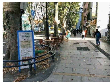
テーブル・椅子の設置による歩道空間