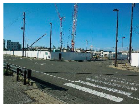
市役所等拠点施設を駅前に集約