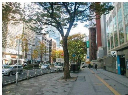
車道削減による歩道拡幅

「社の都」のシンボルである「青葉通」及び「定禅寺通」の魅力向上のための道路空間の再構成と利活用について