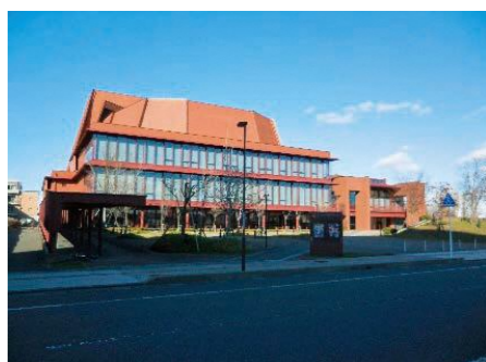
復興のシンボル「文化会館アルフォーレ」