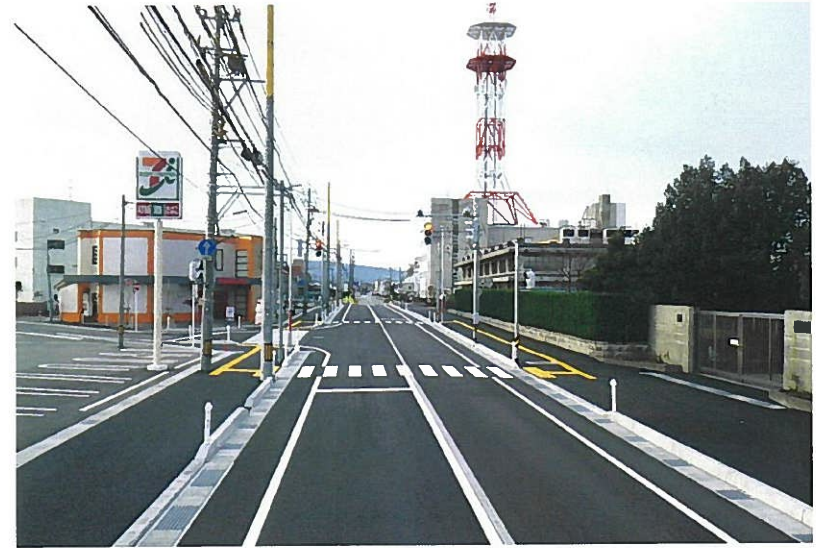
東建設(株)施工の「都市計画道路双代線街路総合交付金道路改良工事」