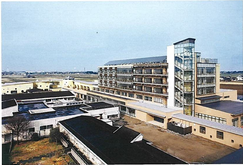
佐藤工業・前田建設工業・日本海建興共同企業体施工の「新たな総合リハビリテーション病院・こども医療福祉センター（仮称）新築その1工事」