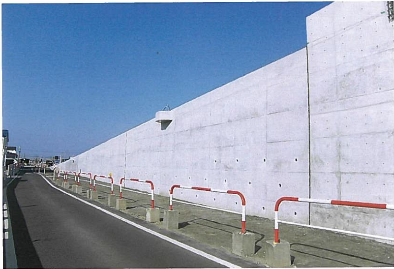
道路技術サービス(株)施工の「主要地方道小杉婦中線道路総合交付金取付擁壁工その4工事」