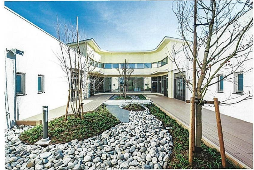
近藤建設・相澤建設・竹原工務店共同企業体施工の「新たな総合リハビリテーション病院・こども医療福祉センター（仮称）新築その2工事」