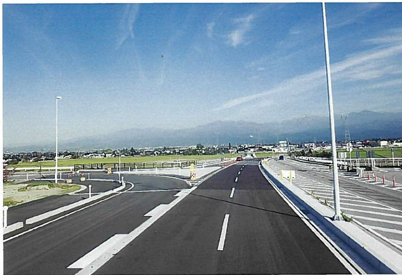
(株)林土木施工の「主要地方道富山立山公園線道路総合交付金（改築）舗装第2工区工事」