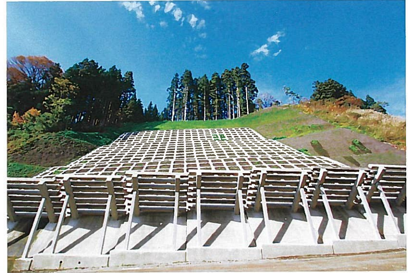
(株)長田組施工の「一般国道304号道路災害復旧工事」