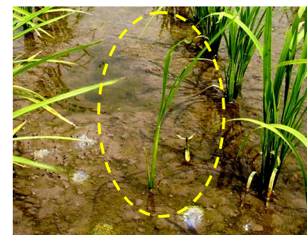
【漏生籾は確実に抜き取る】