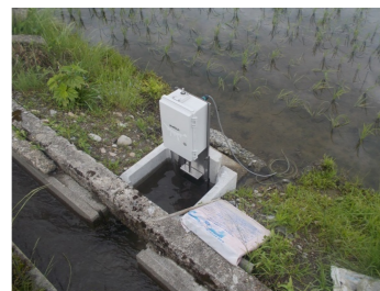
自動給水栓の設置状況 (写真は遠隔操作式)