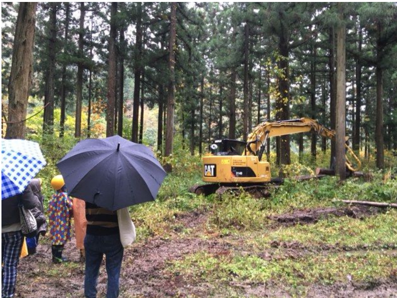
森林内での伐採の様子