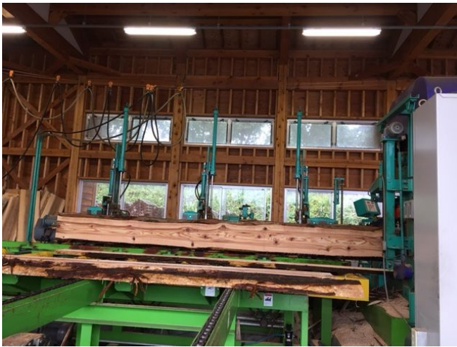
新川森林組合の木材加工場の製材機