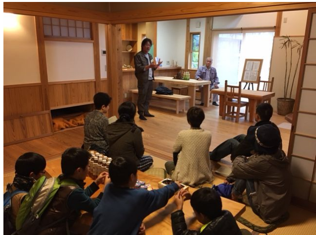
住宅展示場内での説明