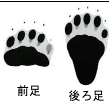
ツキノワグマの足跡

山菜はクマも好物です。山菜の多いところにはクマもいることが多いので、 足跡や糞などを見つけたら引き返しましょう。