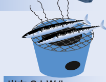
出力 ? kW/h