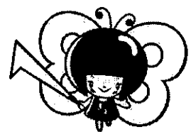
消費者庁 消費者ホットライン188 イメージキャラクター イヤヤン