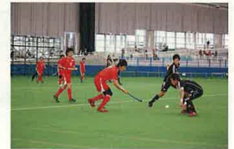
地域に根付くスポーツ（小矢部市）

五箇山県立自然公園や白山国立公園などの豊かな自然環境を保全するとともに、地域特性を活用した再生可能エネルギーの導入を促進します。また、豊かな水資源の保全と有効活用に努めます。