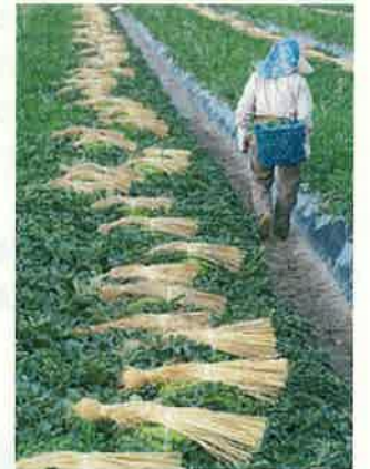
ジャンボ西瓜(入善町)

黒部峡谷、宇奈月温泉等の魅力ある観光資源を活用し、滞在・体験型観光の推進を図るとともに、富山湾・黒部峡谷・越中にいかわ観光圏等とも連携しながら、選ばれ続ける観光地づくりを進めます。