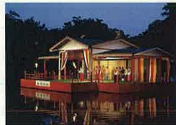
越中万葉朗唱の会（高岡市）