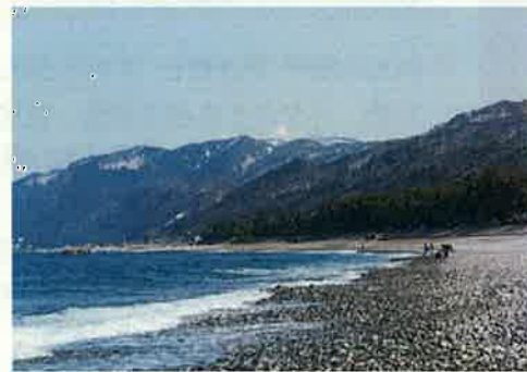
ヒスイ海岸(朝日町)

地域資源の活用や都市住民との交流、豊かで多様な「とやまの森」の整備・保全などを通じて、個性豊かな魅力ある農山漁村づくりを進めます。