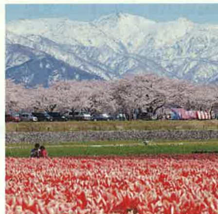
朝日岳・白馬岳(朝日町)