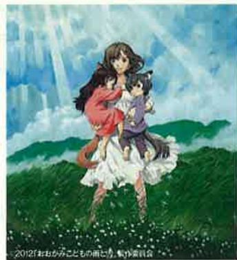
富山地域をイメージした映画による魅力発信(映画「おおかみこどもの雨と雪」より)