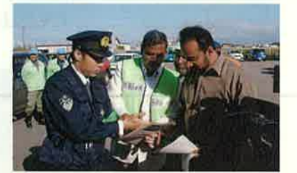
地域住民と協力して取り組む防犯パトロール（射水市）