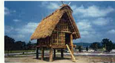
縄文の桜町遺跡（小矢部市）

地域資源の活用や都市住民との交流、豊かで多様な「とやまの森」の整備・保全などを通じて、個性豊かな魅力ある農山村づくりを進めます。