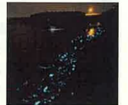
ホタルイカ群遊(滑川市)

広域的な交通基盤である北陸新幹線、伏木富山港(富山地区)等の整備促進や富山空港の機能充実、交通アクセスの向上等により、賑わいの創出、地域の活性化を図ります。