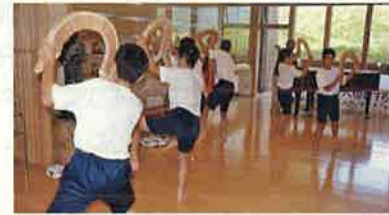
地域の伝統文化を学ぶ（南砺市）

自然、歴史・伝統文化など、富山らしい地域の魅力の継承、再発見と地域の魅力発信による交流人口の拡大、定住・半定住の促進に努めます。