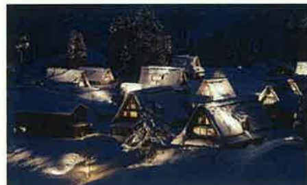
五箇山合掌造り集落(南砺市)