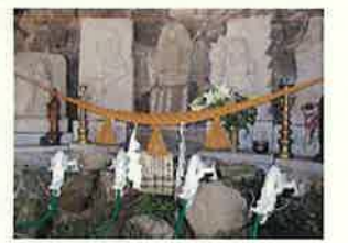
穴の谷の霊水(上市町)

自然環境に配慮しつつ、治山・治水・海岸保全等の施設整備を着実に進めるとともに、防災・防犯対策の充実による安全・安心なまちづくりを進めます。