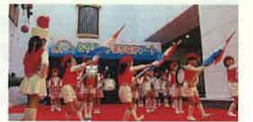
とやまっ子まちなかアート(富山市)