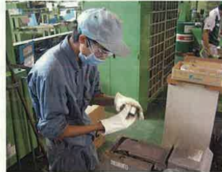
高校生インターンシップ(魚津市)

自然、歴史・伝統文化など、富山らしい地域の魅力の継承、再発見と地域の魅力発信による交流人口の拡大、定住・半定住の促進に努めます。