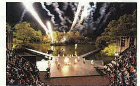
利賀芸術公園での舞台公演 「世界の果てからこんにちは」(南砺市)