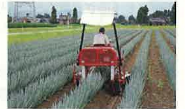
ねぎ土寄せ(立山町)

立山黒部アルペンルートなど、恵まれた自然景観や歴史・文化等の観光資源を活用し、滞在・体験型観光の推進を図るとともに、立山黒部アルペンルート広域観光圏等とも連携しながら、選ばれ続ける観光地づくりを進めます。