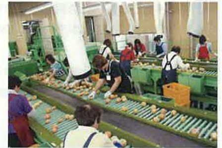
たまねぎ選果(砺波市)

五箇山の合掌造り集落などの歴史的資産、全国的なイベントを活用し、滞在・体験型観光の推進を図るとともに、越中・飛騨観光圏等とも連携しながら、選ばれ続ける観光地づくりを進めます。