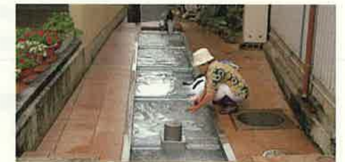
共同洗い場(黒部市)