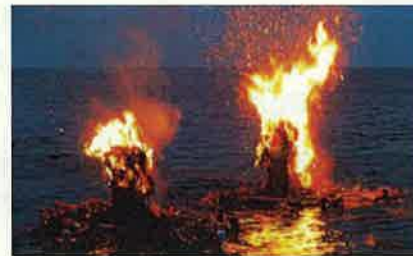
ネブタ流し(滑川市)

地域資源の活用や都市住民との交流、豊かで多様な「とやまの森」の整備・保全などを通じて、個性豊かな魅力ある農山漁村づくりを進めます。