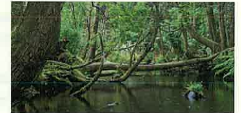
杉沢の沢スギ(入善町)

自然環境に配慮しつつ、治山・治水・海岸保全等の施設整備を着実に進めるとともに、防災・防犯対策の充実による安全・安心なまちづくりを進めます。