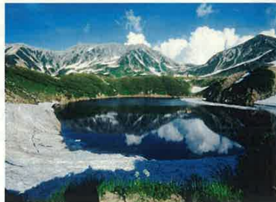
室堂みくりが池(立山町)