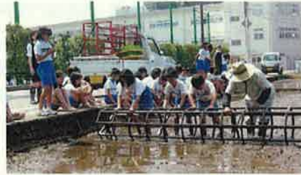
田植え体験(舟橋村)

自然、歴史・伝統文化など、富山らしい地域の魅力の継承、再発見と地域の魅力発信による交流人口の拡大、定住・半定住の促進に努めます。