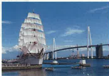
新湊大橋と海王丸(射水市)