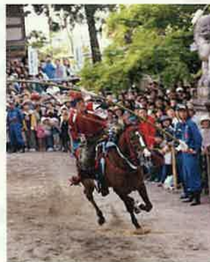
やんさんま（射水市）

地域資源の活用や都市住民との交流、豊かで多様な「とやまの森」の整備・保全などを通じて、個性豊かな魅力ある農山漁村づくりを進めます。