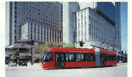
万葉線アイトラム(高岡市・射水市)