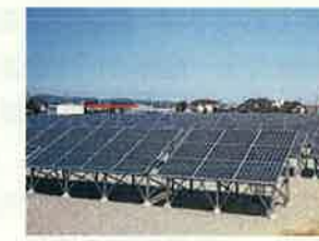
メガソーラー(富山市)