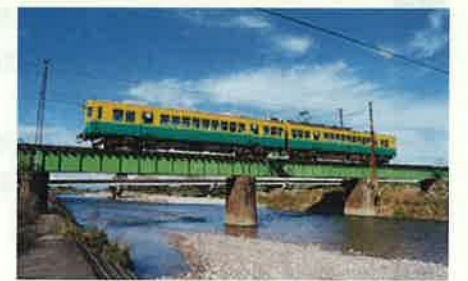
映画「RAILWAYS 愛を伝えられない大人たちへ」の舞台となった、富山地方鉄道(魚津市片貝川橋梁付近)