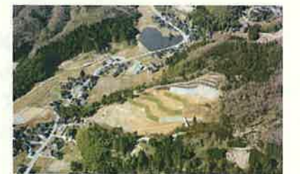
地すべり対策（氷見市）