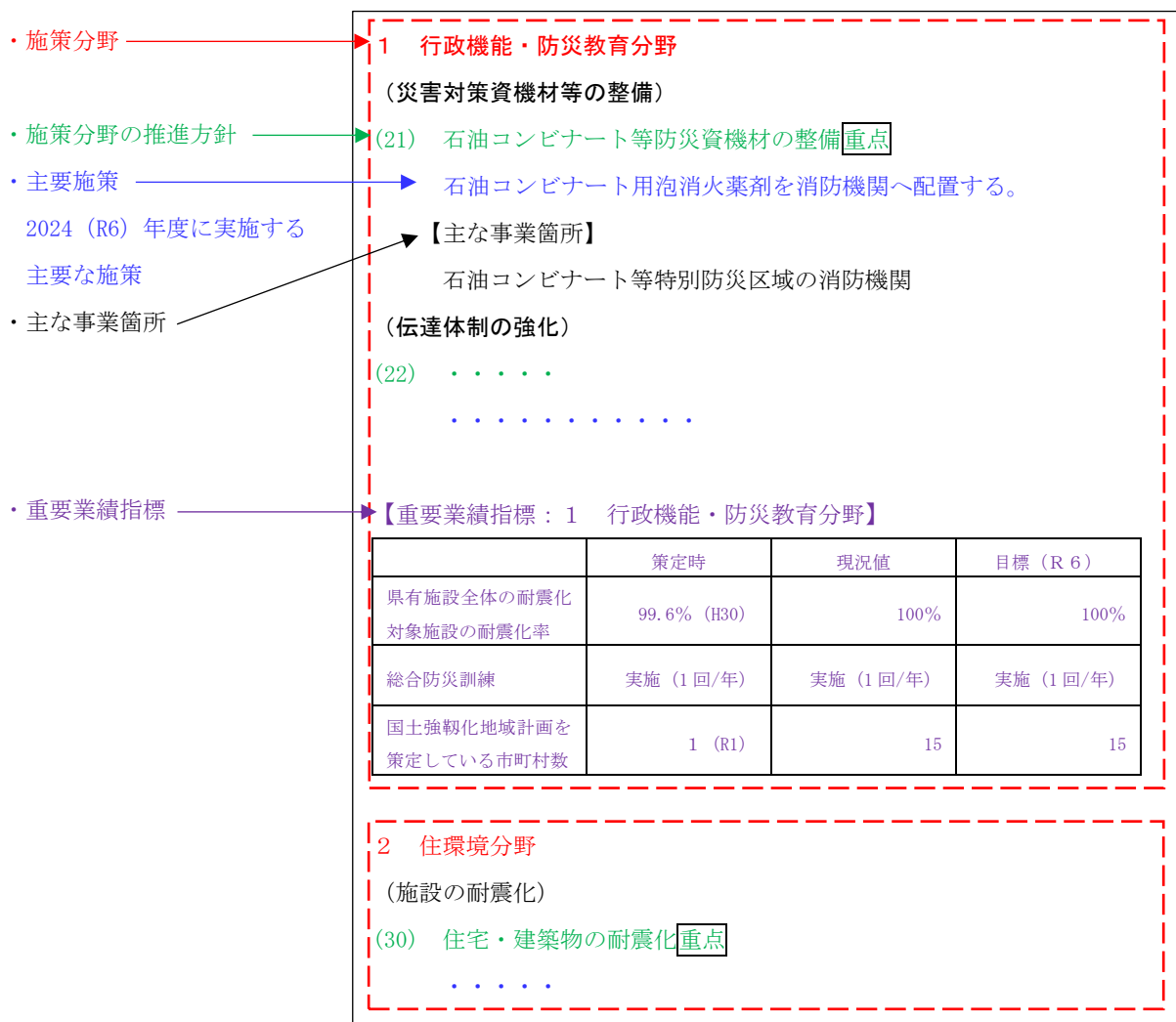
図2 アクションプラン構成イメージ