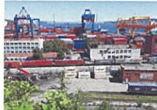
シベリア鉄道 (ウラジオストク商業港)

<要件>シベリア鉄道を利用した輸送実験であること <交付額>補助率1/2 上限額150万円