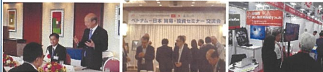
タイ王国工業省ウッタマ大臣との会談 ベトナム経済セミナー開催 ビジネスセミナーの開催(H30.6) (H30.5) METALEX2018 富山県企業出展(H30.11)