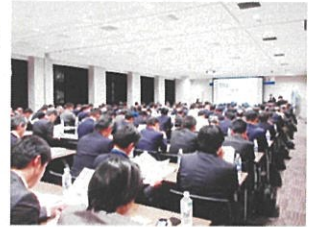
伏木富山港利用促進セミナーin東京