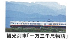
観光列車「一万三千尺物語」