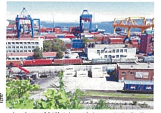
シベリア鉄道(ウラジオストク商業港)