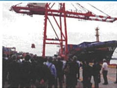
伏木富山港現地視察会(富山新港)