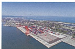
新湊地区:国際物流ターミナル

伏木地区:【継】臨港道路伏木外港1号線の整備 新湊地区:【継】西理立地緑地整備 富山地区:【継】臨港道路西宮線の整備