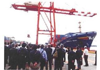
伏木富山港現地視察会(富山新港)