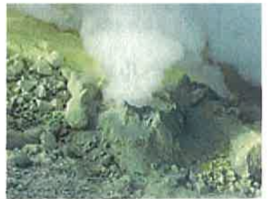
地獄谷の様子 Volcanic gas at Jigokudani 地獄谷の様子 지고쿠다니의 모습

Report emergencies by calling #110. 緊急時請向110通報。 緊急時請向110通報。 긴급 시에는 110번에 전화 부탁드립니다