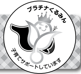
「プラチナくるみん」マーク

マントの色は12色あるよ。 (ピンク色、だいだい色、 黄色、緑色、青色、紫色) またはこれらの淡色 企業のカラーに合った色を選 択することができるよ。