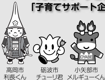
高岡市 利長くん 砺波市 チューリ君 小矢部市 メルギューくん

地域の活性化を応援し、人々を元気にする仲間たち(富山県内では高岡市の「利長くん」、砺波市の「チューリ君」、小矢部市の「メルギューくん」とコラボもしています!