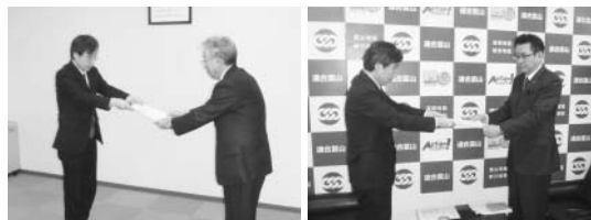
1月30日、富山県経営者協会にて

また、富山労働局働き方改革推進本部においては、所定外労働時間の削減、休暇の取得促進をはじめとした「働き方の見直し」に向け、本部長が(一社)富山県経営者協会と日本労働組合総連合会富山県連合会(連合富山)を訪問して要請書を手渡すなど、団体や企業への働きかけの強化に取り組んでいます。