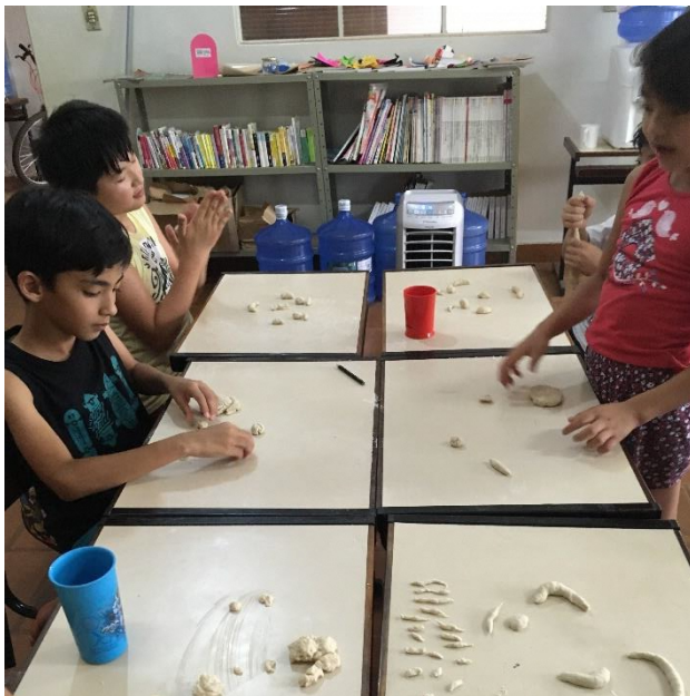
小麦粘土で動物を制作中です! ひらがなババ抜き、意外と盛り上がります!