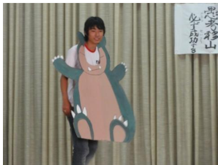
卒業したとしおも参加しました。ちょっとかんでしまいました。