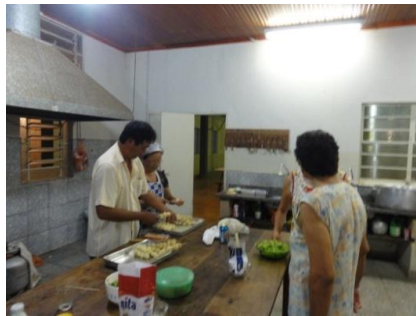
ゆでてから、串に刺します。