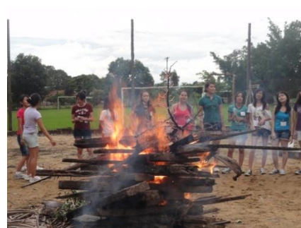
芸術的な、キャンプファイヤー。ちょっと、火の付きが、悪かったのが残念でした。