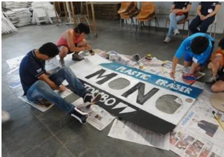
工作のようす。第1アリアンサ正雄の班はMONOの消しゴムです。でも、0の縁取りが無いんじゃない？

1月17日～19日の日程で、高学年の林間学校がアラサツバで開催されました。工作、レクリエーション、調理、キャンプファイヤー、ダンスパーティー、劇など盛りだくさんの内容でした。