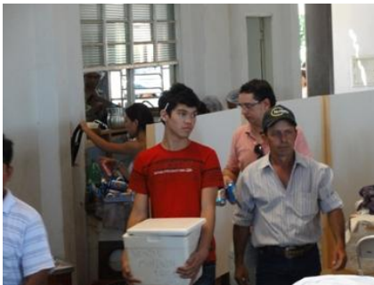
剛、ガルソンを頑張っていました。剛は家の手伝いも頑張ります。