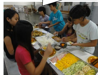
天ぷらの他に手巻き寿司。バットの中の黄色いのは「マンゴー」です。意外とイケる？そして、納豆巻きもありました。