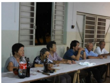
こちらは、審査員のみなさん。