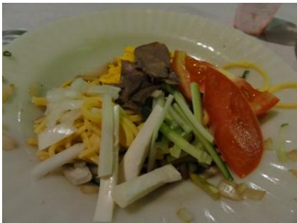
左の白いのはパウミット（ヤシの新芽）。これが美味しい。たれも手作りでした。