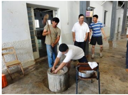
これは、私。今年も足を引っ張って しまいました。