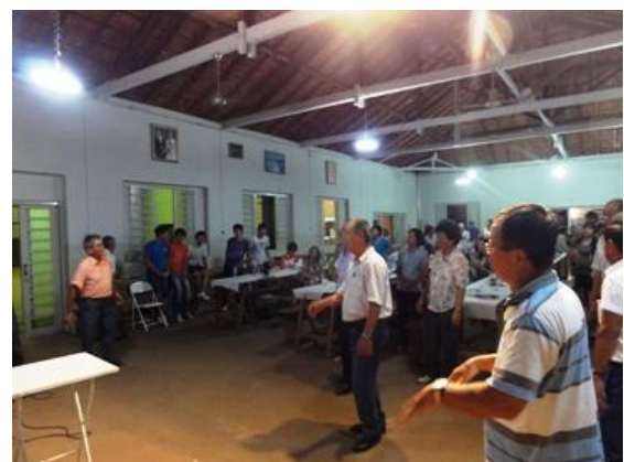
最後は 「北国の春」 を大合唱。