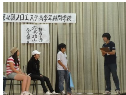
第2アリアンサの津村先生（右）は、泥棒の先生という設定で登場。