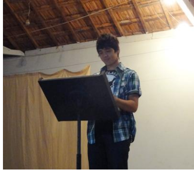
幼なじみのヤンが、贈る言葉。「またいつか、一緒に野球ができる日を楽しみにしています。」