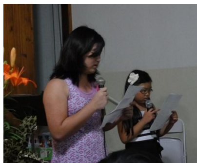
まゆみと、みずきの2人で、日本の重大ニュースを紹介しました。