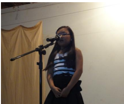
みずき「日本語学校では、神経衰弱と塗り絵が好きです。いつも私が勝ちます」本当です。いつも負けます。