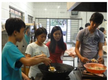
私の班は、1番早く調理したのですが、他の班ができるまで食べるのを待っていました。冷めてしまったけれど、おいしかったですね！