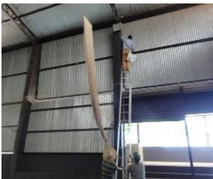
こちらは、切れた電球の交換。私な ら、びびって腰が抜けるところです。