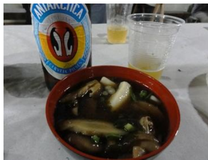
これがアリアンサのお雑煮です！