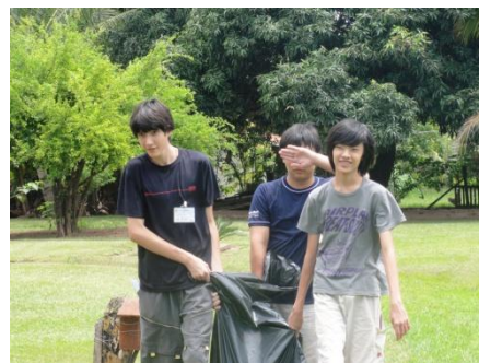
こちらは、水風船を運んでいます。顔を隠しているのはとしあき。怪しい。