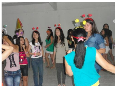
ダンスパーティーの様子。