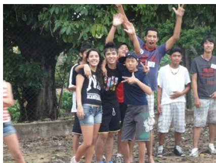
フォークダンスで記念撮影。「先生、こっちの写真、お願い！」と、日本語を使っていましたね。