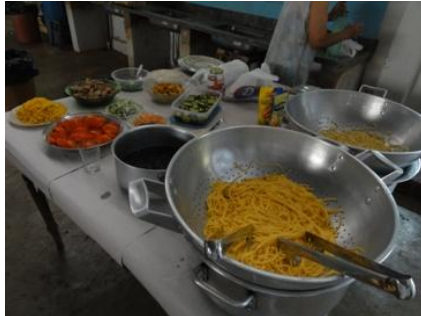
できあがり。ブラジルでは、いつもこの様に準備してから、1人ずつ取って行きます。