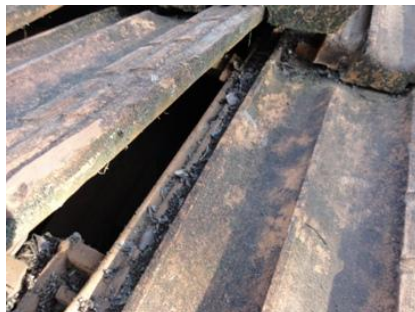
瓦と瓦のつなぎ目に、スジェイラ（ゴミ）が詰まっています。これを取り除きます。