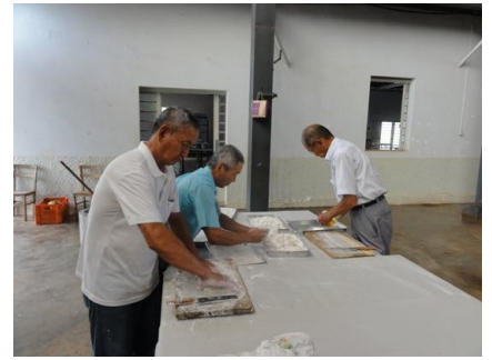
こちらは、餅を切って、雑煮に あった大きさにしています。