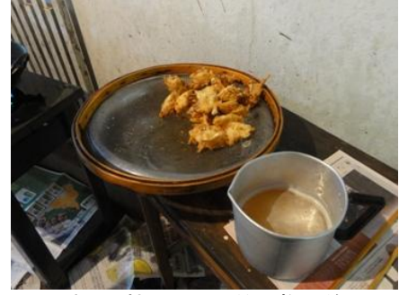
天ぷらは熱いので、飲み物の差し入れ。