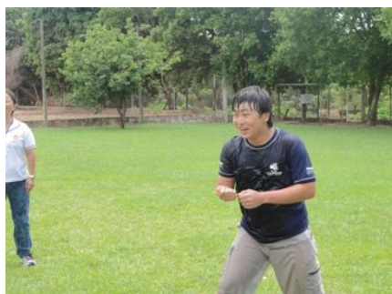
水風船を、串で割ります。としあき、水びたし。でも、暑いから気持ちいいね！