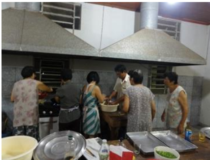
鶏団子を一度、ゆでます。

3月15日、婦人会の集まりで、ざるそばと、焼き鳥 (つくね) を作りました。私がよく行く高岡にある名店の味を、どうしても伝えたかったのです。この日は20人位の人に参加しました。