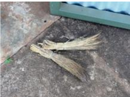
ほうきを小さくしたのを使います。

昨年から、学校の雨漏りがひどく、修繕をお願いしていたのですが、ゴミが詰まっているからだろうのことで、村で時間のある人が集まって、屋根の掃除をしました。私も、申し訳ないので手伝ったのですが、瓦を3枚割ってしまい、手伝ったのか、邪魔をしたのかわからない