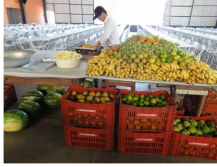
今回は、いつもにもましてFruta (果物) に力が入っていました。見てください、この量。