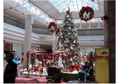
試験の後はショッピングセンターに。 頑張ったご褒美ですね。