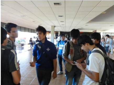
休憩の様子。出来はどうでしょう？ ヤンの服に注目。日本の体操服です。