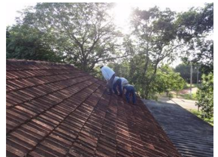
瓦の真ん中に乗ったら割れて、しまいます。下の、少し厚くなっている所に乗らなければなりません。