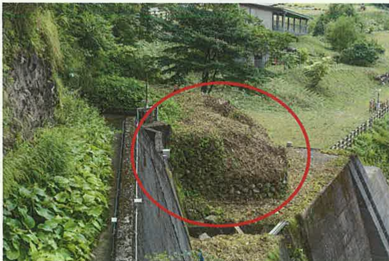
旧混合配給所基礎石垣