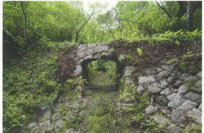
山腹工の水路工と石橋