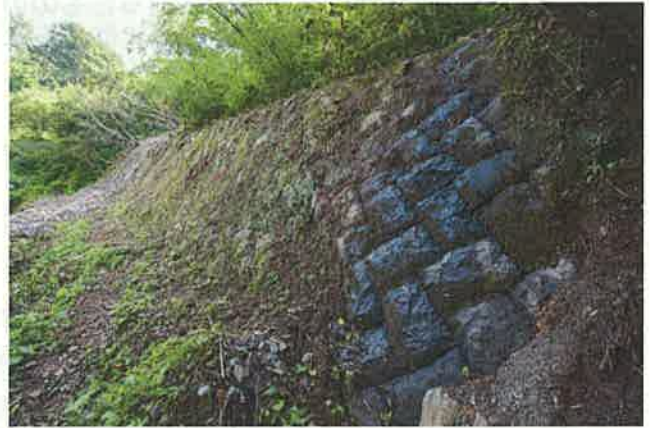
山腹工の山腹基礎工